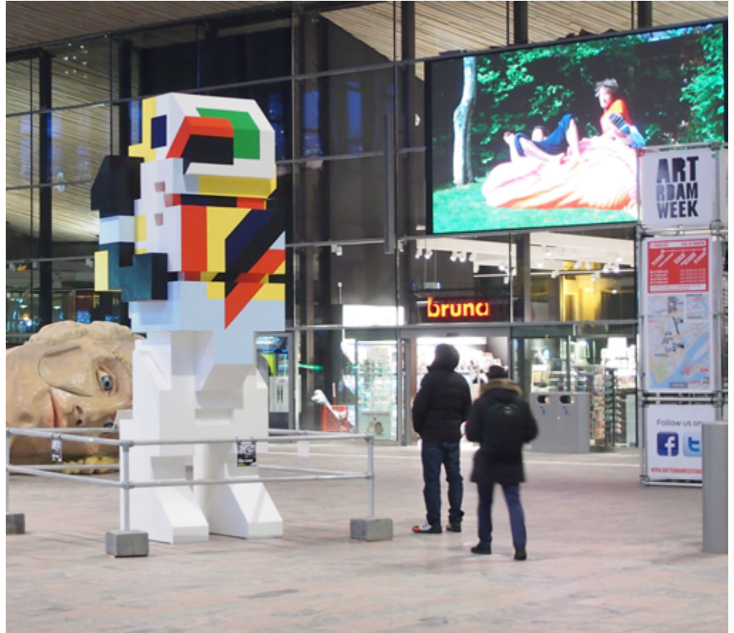
Boris-Tellegen, «Delta R'damCS», 2014

De presentatie van de vaste collectie kan worden aangepast aan de tijdelijke tentoonstellingen om die een extra historisch kader te verlenen.